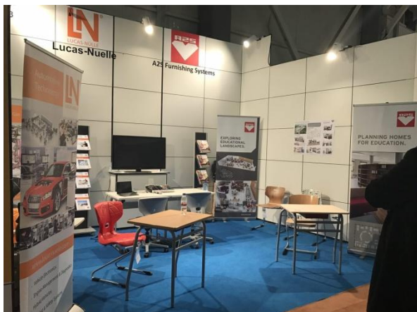
Bsp.: Standbau der Education Technology Iran

offenbarte sich das enorme Interesse der Iraner an deutschen Produkten. Mit einem hochwertigen Standbausystem und kompetenten Ansprechpartnern konnten die deutschen Aussteller dem Ruf ihrer Service- und Produktqualität gerecht werden. Den ETI Stand besuchte u.a. der Bildungsminister,