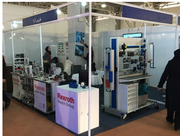
Bsp.: Standbau der 17. National Exhibition of Technological and Research Achievements